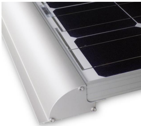
Spoiler in Silber ELOXAL mit seitlicher Abdeckung